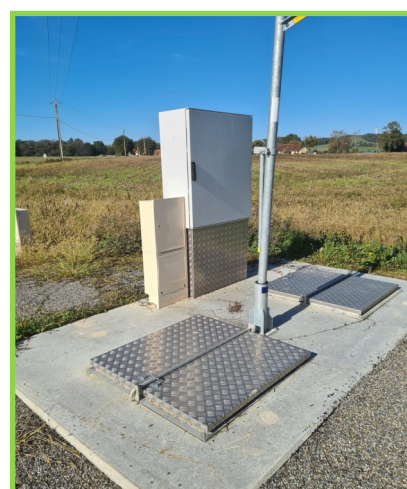
Pompe de relevage